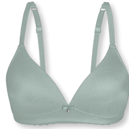
15424 A - C | 70 - 90