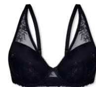
24451 | Schalen-BH / padded bra / SG paddé B-D | 75-95