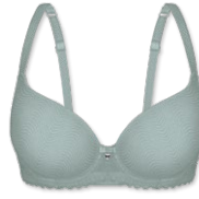
25424 | Schalen-BH / padded bra / SG paddé B-D | 75-95