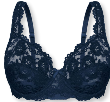
24660 B - E | 75 - 100