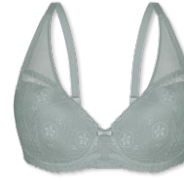
25421 | Schalen-BH / padded bra / SG paddé B-D | 75-95