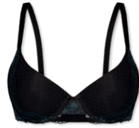
24434 | Push Up-BH / push up bra / SG push up A-C | 70-90