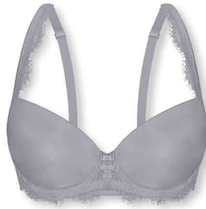
25423 B - D | 75 - 95