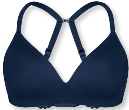
14660 A - C | 70 - 95