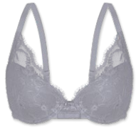
25422 | Schalen-BH / padded bra / SG paddé B-D | 75-95