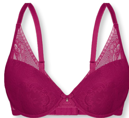
24436 B - D | 75 - 95