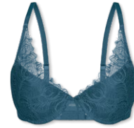
25405 | Push Up-BH / push up bra / SG push up A-C | 70-90