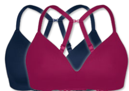
14660 | Soft-BH Einlage / padded soft cup bra / SG paddé sans armatures A-C | 70-95