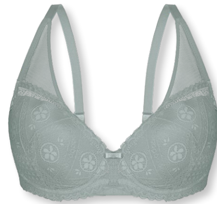
25421 B - D | 75 - 95