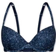
25417 | Schalen-BH / padded bra / SG paddé B-D | 75-95