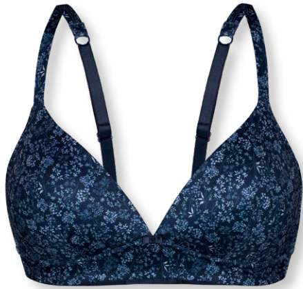
15417 A - C | 70 - 90