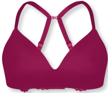
14660 A - C | 70 - 95