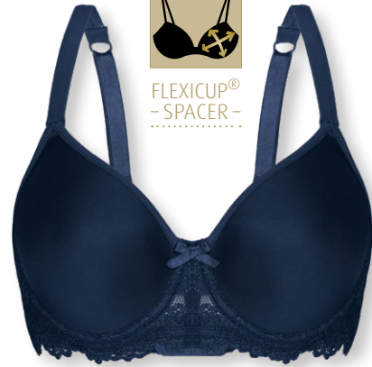
24560 B - E | 75 - 95