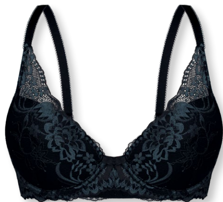
24435 B - D | 75 - 95