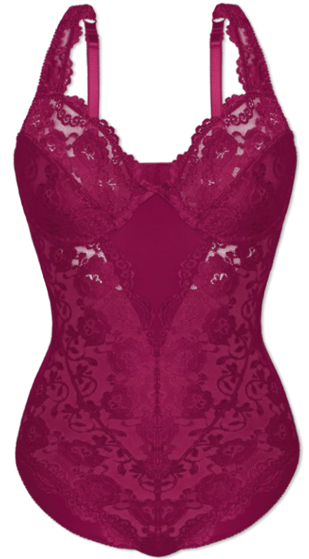
904 B - D | 75 - 100