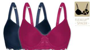
24560 | Spacer-BH / spacer bra / SG spacer B-E | 75-95 | FLEXICUP

Cupmaterial / cup material / coupe le matériel: 90% Polyester 10% Elasthan / elastane / élasthanne