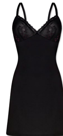
34450 | Négligé/ negligee/ nuisette 36-44