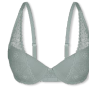
25420 | Push Up-BH / push up bra / SG push up A-C | 70-90