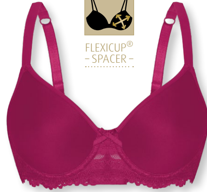
24560 B - E | 75 - 95