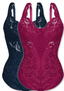
904 | Body / body B-D | 75-100