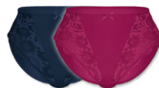
562 | Miederslip / girdle / culotte gainante 36-48

Grundware / main material / matériel de base: 90% Polyamid / polyamide 10% Elasthan / elastane / élasthanne Spitze / lace / dentelle: 90% Polyamid / polyamide 10% Elasthan / elastane / élasthanne