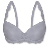
25423 | Schalen-BH / padded bra / SG paddé B-D | 75-95