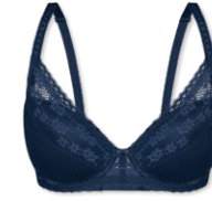
25419 | Schalen-BH / padded bra / SG paddé B-D | 75-95