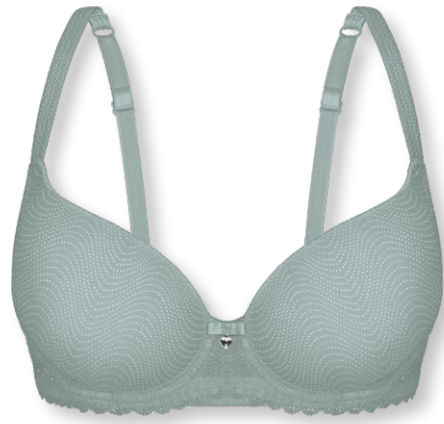
25424 B - D | 75 - 95