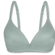
15424 | Soft-BH Einlage / padded soft cup bra / SG paddé sans armatures A-C | 70-90