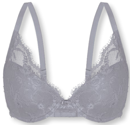
25422 B - D | 75 - 95