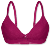
14436 | Soft-BH Einlage / padded soft cup bra / SG paddé sans armatures A-C | 70-90