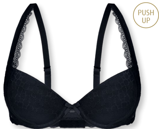
24437 A - C | 70 - 90