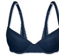
25418 | Push Up-BH / push up bra / SG push up A-C | 70-90