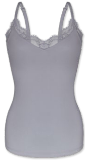
35422 | Top / top 36-44