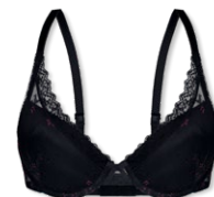
24450 | Push Up-BH / push up bra / SG push up A-C | 70-90