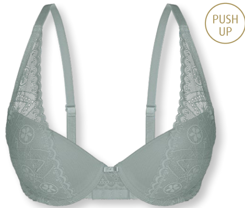
25420 A - C | 70 - 90