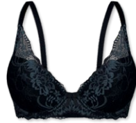
24435 | Schalen-BH / padded bra / SG paddé B-D | 75-95