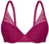
24436 | Schalen-BH / padded bra / SG paddé B-D | 75-95