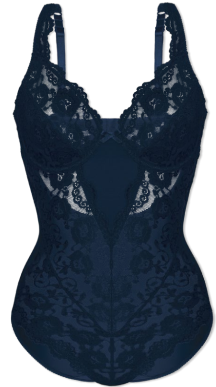
904 B - D | 75 - 100