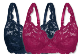
24660 | Bügel-BH / wire bra / SG avec armatures B-E | 75-100

Cupmaterial / cup material / coupe le matériel: 90% Polyester 10% Elasthan / elastane / élasthanne