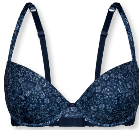
25417 B - D | 75 - 95