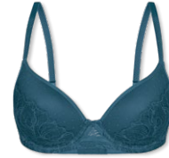
25406 | Schalen-BH / padded bra / SG paddé B-D | 75-95