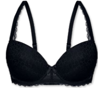
24438 | Schalen-BH / padded bra / SG paddé B-D | 75-95