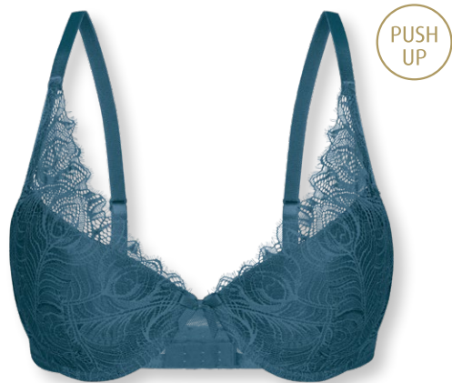
25405 A - C | 70 - 90