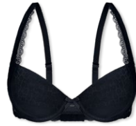
24437 | Push Up-BH / push up bra / SG push up A-C | 70-90