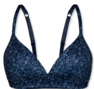
15417 | Soft-BH Einlage / padded soft cup bra / SG paddé sans armatures A-C | 70-90