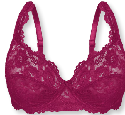
24660 B - E | 75 - 100