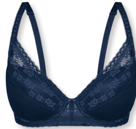
25419 B - D | 75 - 95