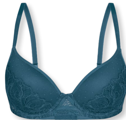
25406 B - D | 75 - 95