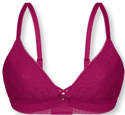
14436 A - C | 70 - 90